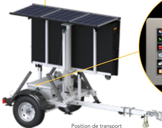
Position de transport